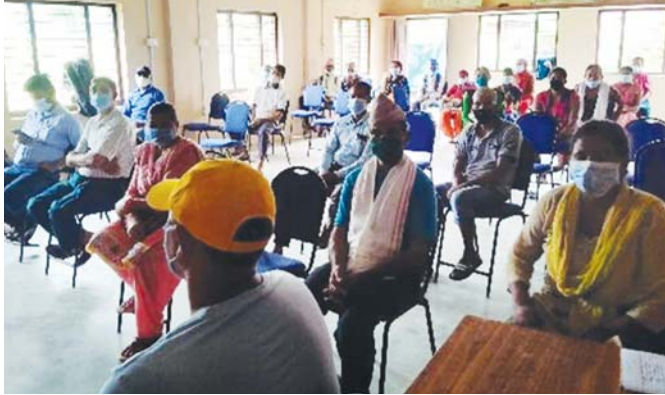
बाँसगढी सामुदायिक पुस्तकालय तथा स्रोत केन्द्रमा राहत सामग्री वितरण गरिदै ।