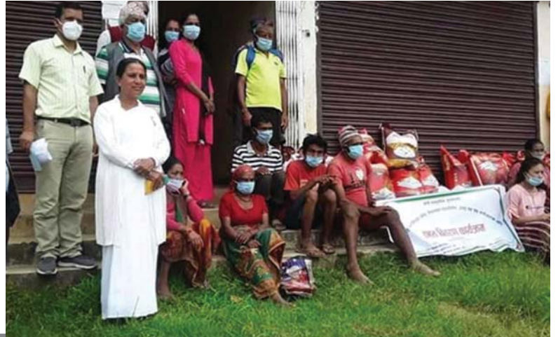
पर्वतको मोती सामुदायिक पुस्तकालय तथा स्रोत केन्द्रमा राहत सामग्री वितरण ।