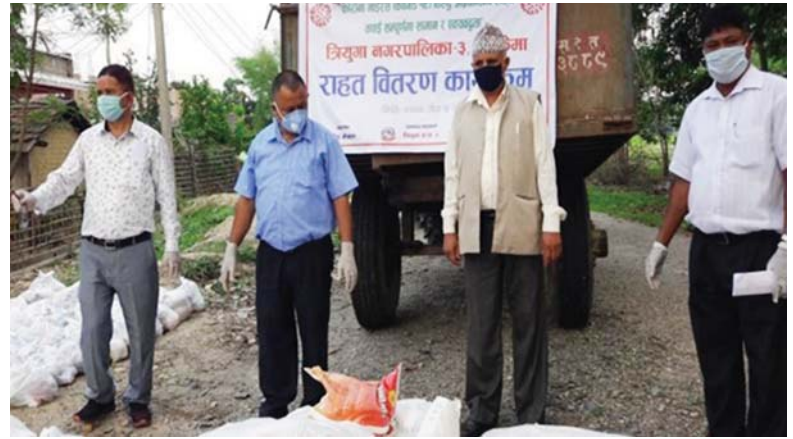
उदयपुरको संगम सामुदायिक पुस्तकालय तथा स्रोत केन्द्रमा राहत सामग्री वितरण ।