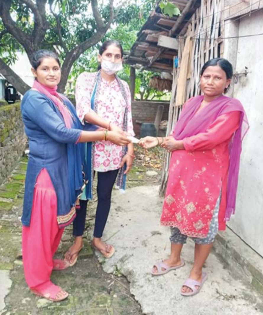
चतुरभुजेश्वर सामुदायिक पुस्तकालय ।

रिड नेपालको सहयोगमा अतिविपन्न परिवारका लागि राहत वितरण गरिएको छ ।