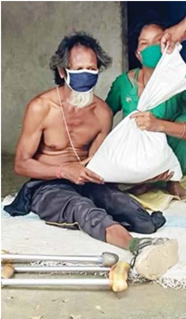
चितवनको दिव्यज्योति सामुदायिक पुस्तकालय तथा स्रोत केन्द्रमा अपांगता भएकालाई राहत सामग्री वितरण ।