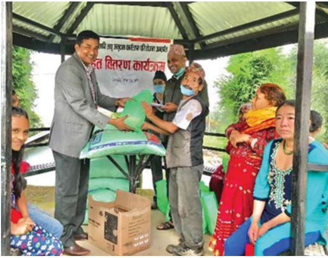
इलामको जनकल्याण सामुदायिक पुस्तकालय तथा स्रोत केन्द्रमा राहत सामग्री वितरण ।