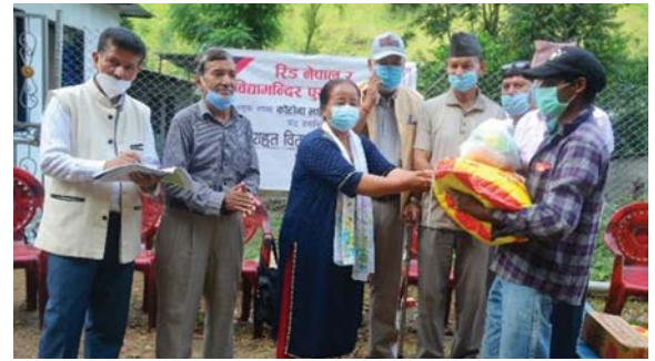
बागलुङको विद्या मन्दिर सामुदायिक पुस्तकालय तथा स्रोत केन्द्रमा राहत सामग्री वितरण ।