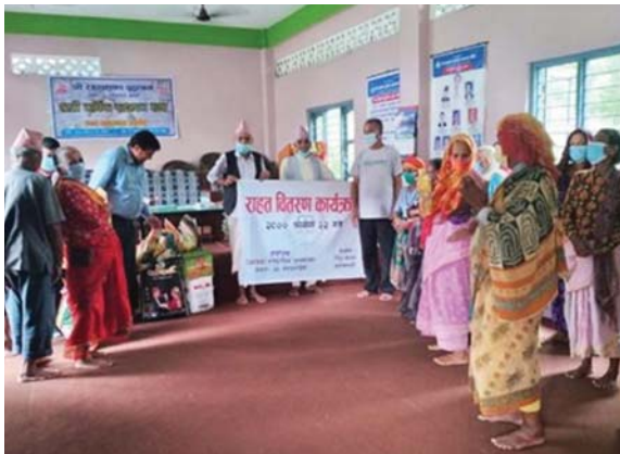
रामेछापको तामाकोशी सामुदायिक पुस्तकालय तथा स्रोत केन्द्रमा राहत सामग्री वितरण ।