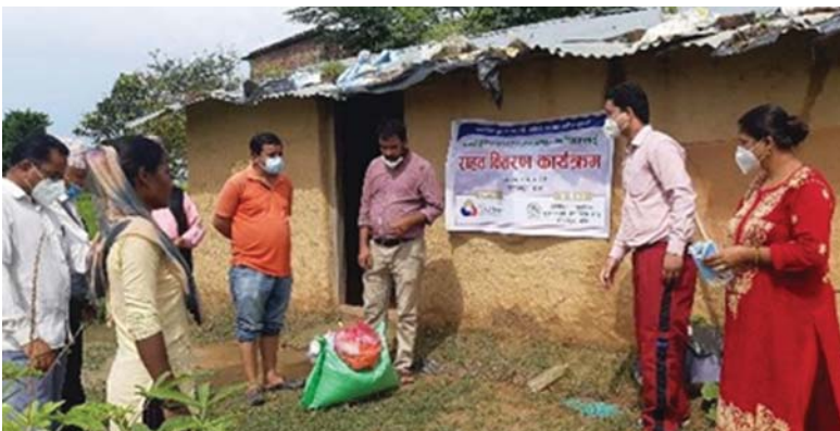
बाँकेको ज्ञानोदय सामुदायिक पुस्तकालय तथा स्रोत केन्द्रमा राहत सामग्री वितरण ।