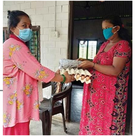
चितवनको दिव्यज्योति सामुदायिक पुस्तकालय तथा स्रोत केन्द्रमा राहत सामग्री वितरण ।