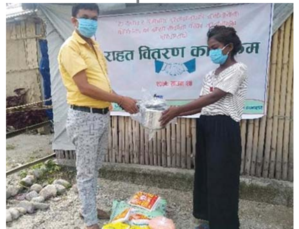
मोरङको लेखनाथ सामुदायिक पुस्तकालय तथा स्रोत केन्द्रमा राहत सामग्री वितरण ।