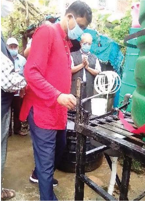
सिन्धुलीको कमला सामुदायिक पुस्तकालय तथा स्रोत केन्द्रमा बास स्टेशन निर्माण र सरसफाई सचेतना ।